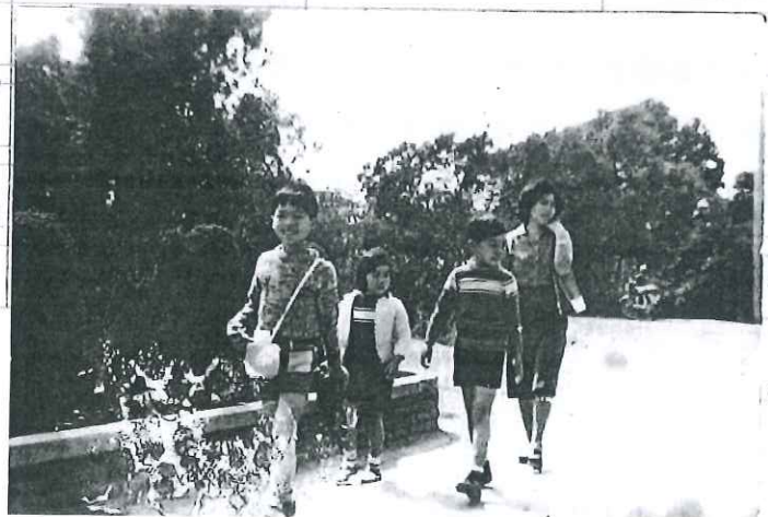
← 太太和 孩子們好開 心上虎頭埤。