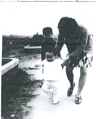
← 虎頭埤畔， 小妹妹 學走路。

聽說，在鄭成功帶領漢人到台灣屯墾時，住在虎頭埤附近的西拉雅族人，都要來這裡砍柴燒飯，女人家常把小孩放在堤岸上的矮樹下休息。日子一久，怪事發生了，小娃娃不見了，在西拉雅族群裡，瀰漫了恐怖氣氛。後來有人在這裡捉魚，發現埤裡有大尾的鱸鰻，不但什麼魚都吃，連人類也無法倖免，不用說那些娃娃，一定是被從水底騰躍而起的大鱸鰻給吃掉了。這件事逐漸傳開，把虎頭埤有水怪的事繪聲繪影，說得大家都不敢在岸上休息了。